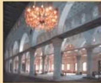
قصر المصالحات من شهر كانون الثاني ١٩٨٨ بمطالبة هوية

- تسجيل الأوكاذ سكان فلسطيني مقدميين، يتم تسجيل الأوكاذ في حالة واحد فقط ألا وهي أن يكون الزوج حامل هوية القدس ماربة للفعول. وهناك اثنتان من الحالات التي تم رفض تسجيل الأوكاذ لأن الولد لا يحمل هوية القدس وبالتالي يحرم الأطفال من حقوق التسجيل كمواطنين في المدينة وابتداءً من حقوق التعليم في مدارس المدينة والعدل القضائي بها ومن حقوق التأمين الصحي والاجتماعي وغيرها.